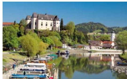
Greinburg in Grein